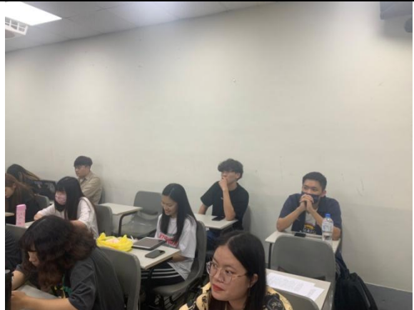
說明：台下同學專心聽講