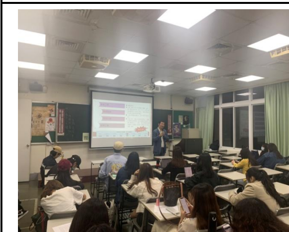
說明：講者與同學分享勞資協商的重要性