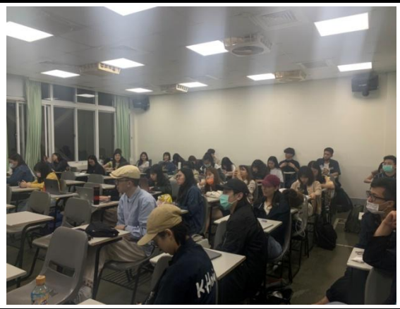
說明：學生上課實況