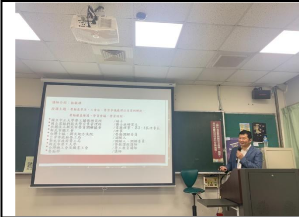
說明：老師上課實況