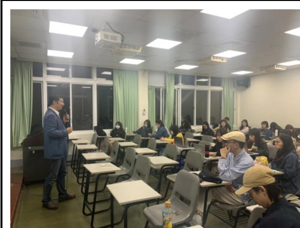
說明：學生上課實況。